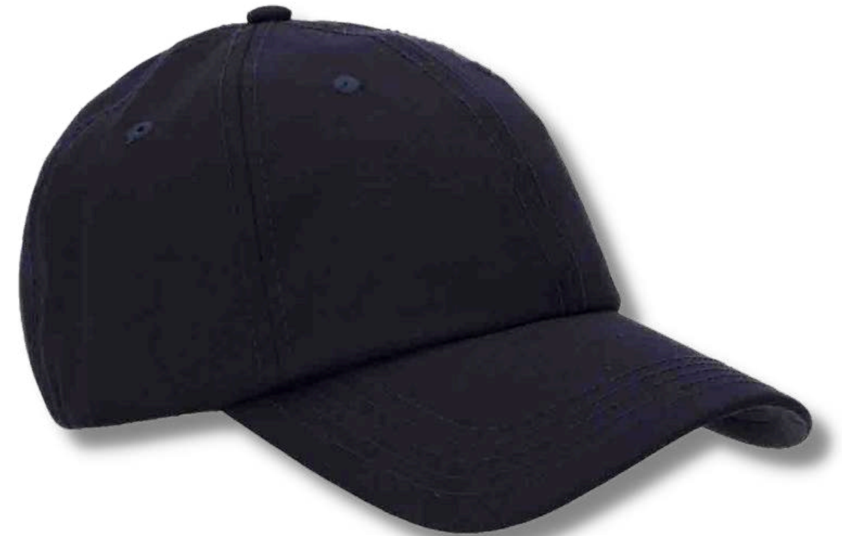
G004U-4 GORRA GABARDINA