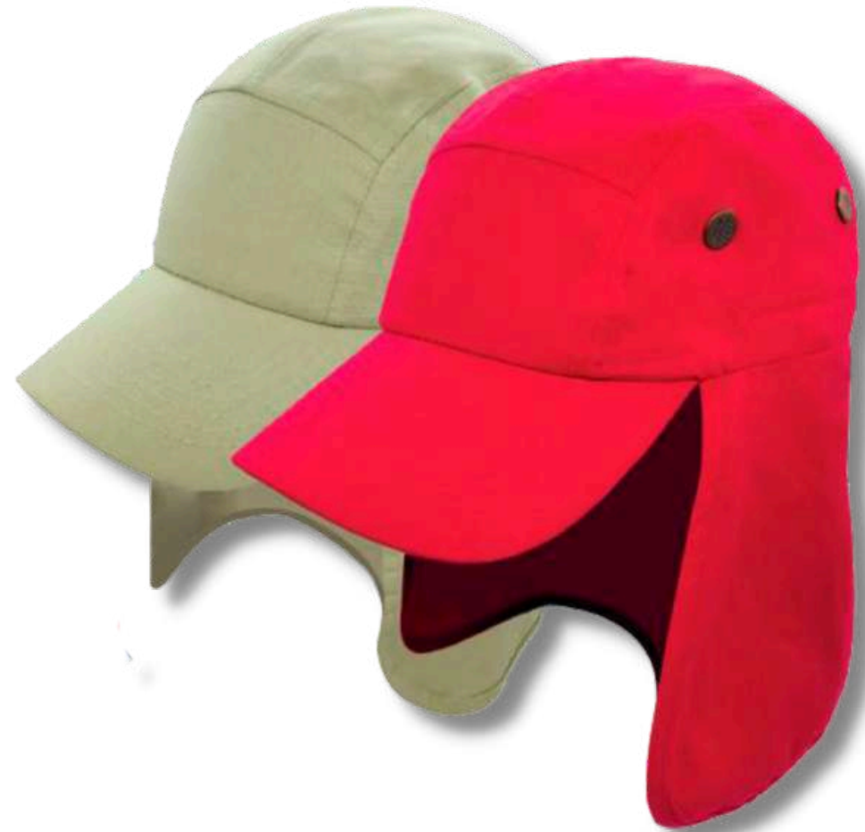
G004U-5 GORRA LEGIONARIA