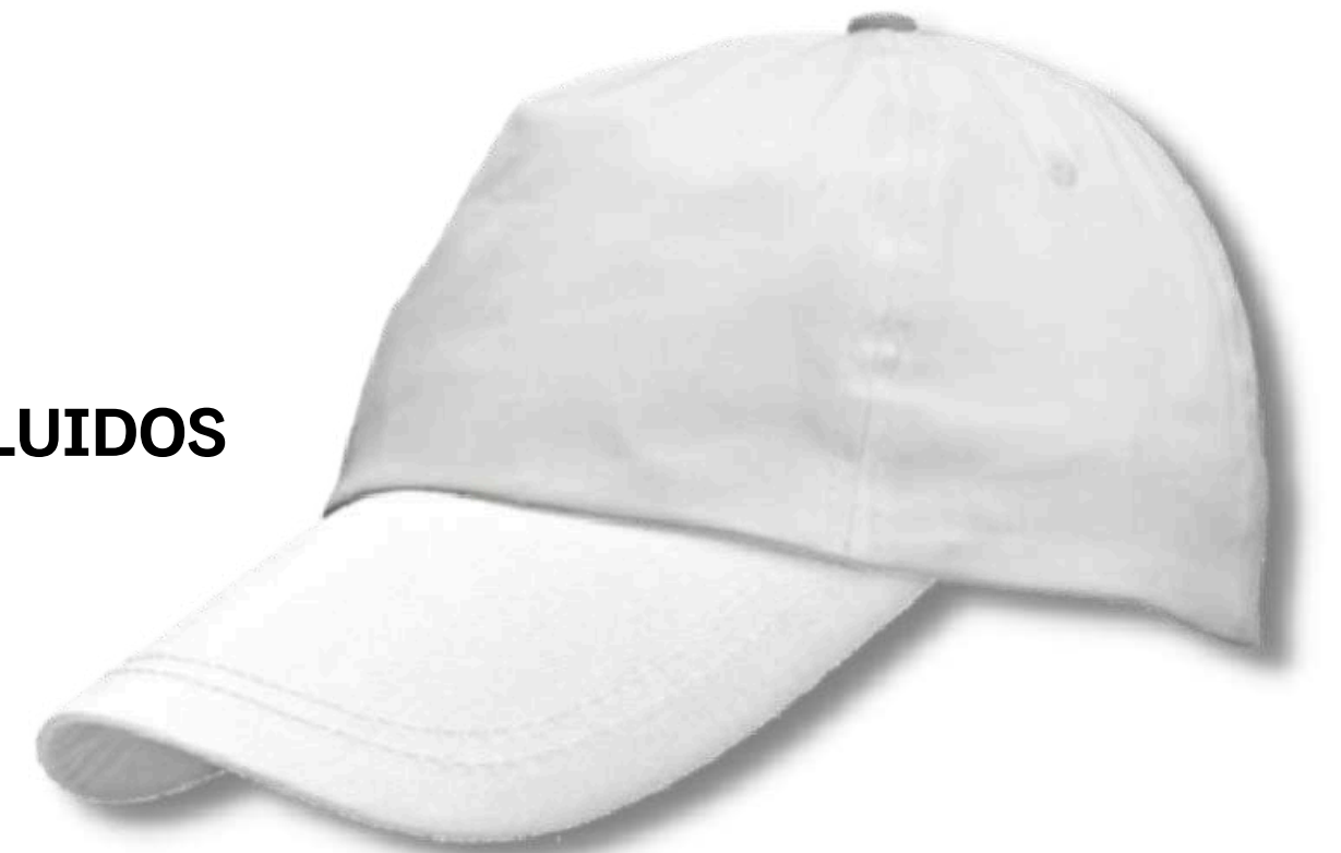
G004U-2 GORRA ANTIFLUIDOS