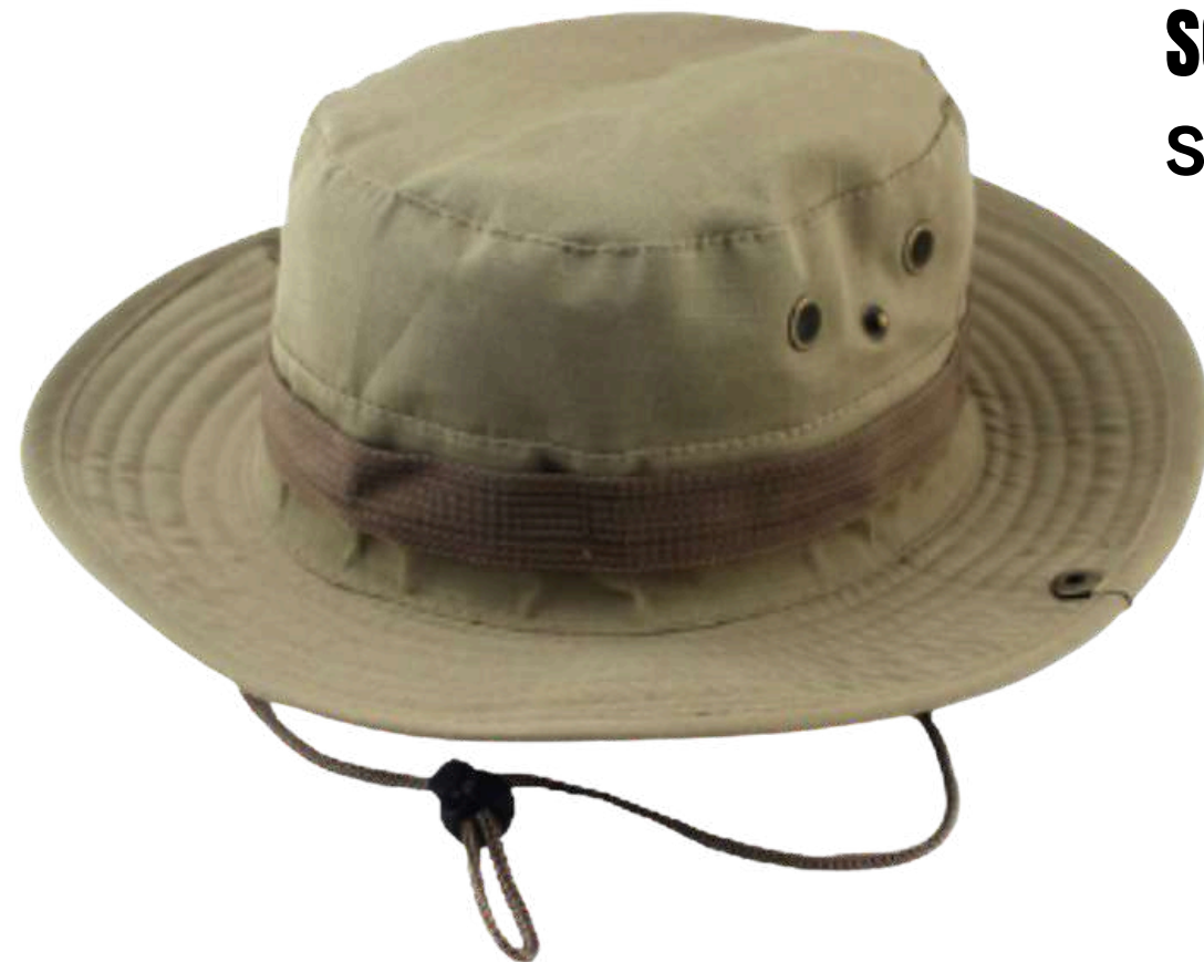
SOM SOMBRERO CAZADOR